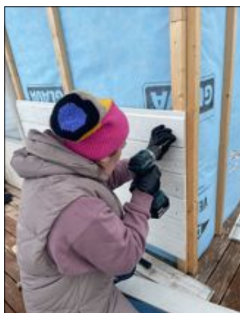
FÅ NYTT LIV: Det at materialer er brukt trenger ikke å bety at det ikke kan gjenbrukes.