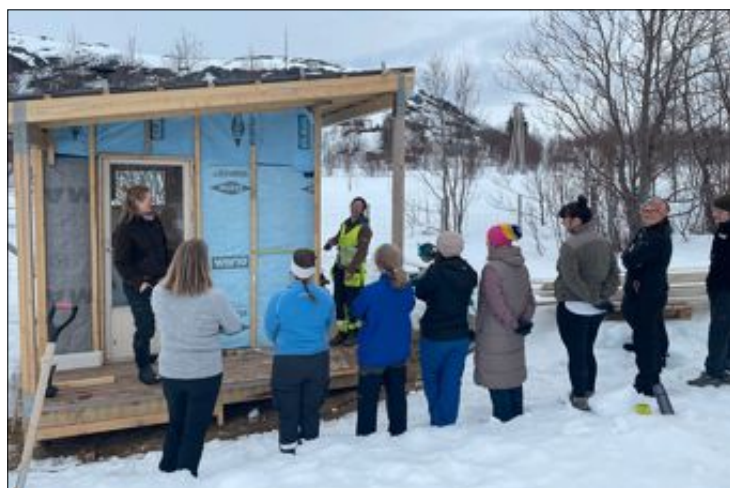
VINN-VINN: Denne flotte badstua er bygget med brukte materialer. Det lønnte seg både for miljøet og lommeboka til utbyggeren.